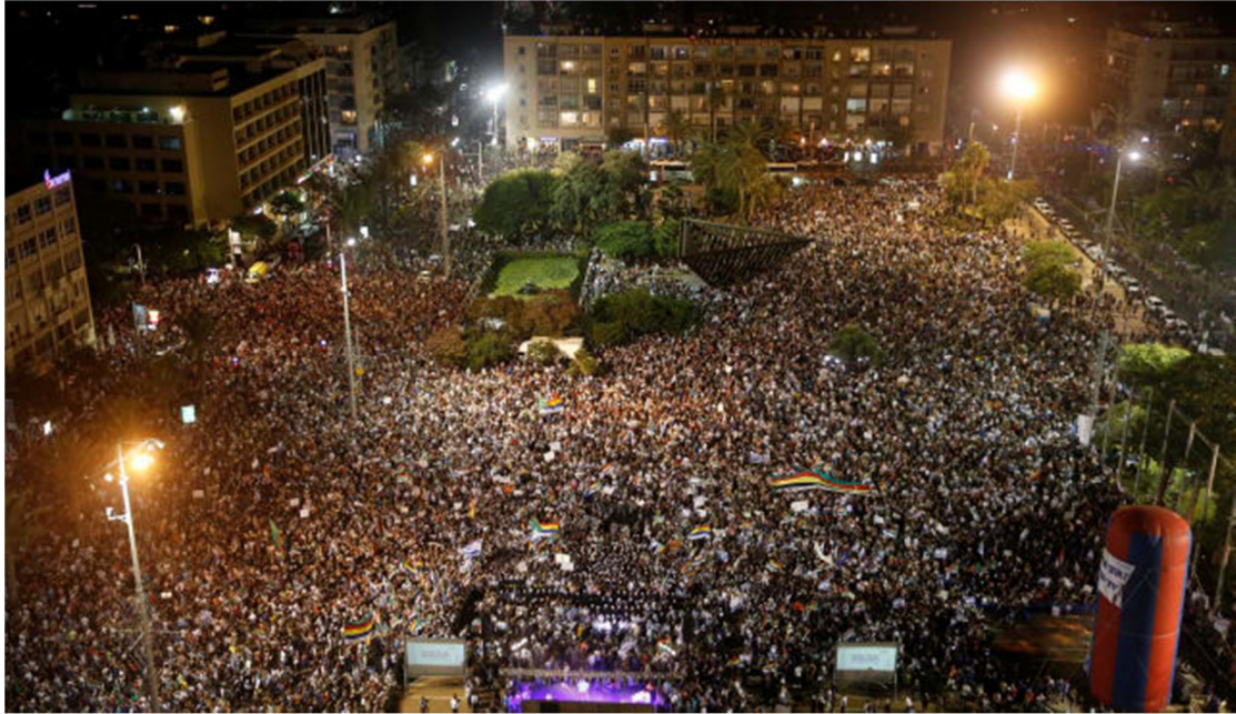
(תמונה מההפגנה בכיכר רבין מיום 04/08/2018)

74. מבלי לפגוע באמור בגוף העתירה כי השוויון אמור להינתן לכלל אזרחי ישראל ללא הבדל דת, גזע ומין וללא קשר לטובות, הטבות או תרומה, נושאים הדרושים בנטל החובות יותר מאשר היהודים עצמם, כך שאין חולק כי אחוז הגיוס לצה"ל מהמגזר הדרוזי עולה על זה שבמגזר היהודי, ועל כן שואלים הדרוזים את עצמם מדוע מדירים אותם מחוק הלאום?! ועת שהם קשרו את גורלם עם העם יהודי עוד לפני קום המדינה ובמשך 70 שנות קיומה של המדינה!!